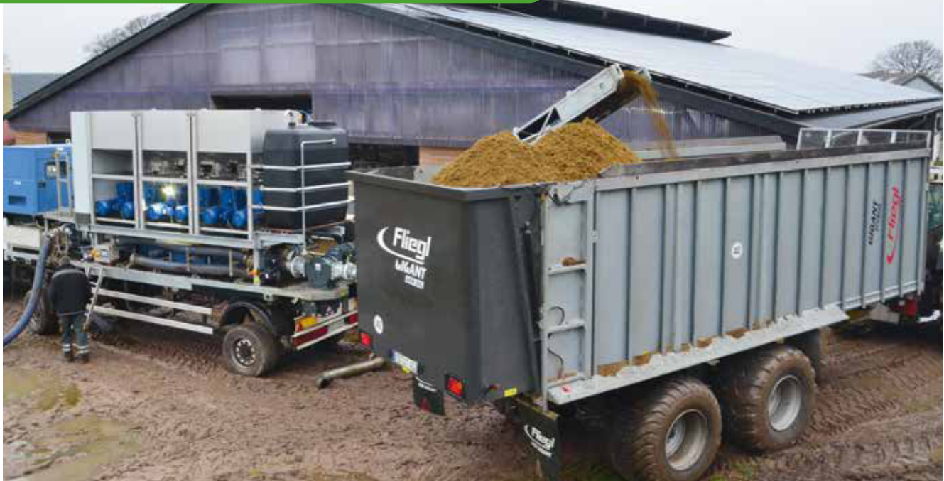
■ Die höchsten Biogausbeuten liefern die Feststoffe aus frischer Rindergülle direkt aus dem Stall separiert.