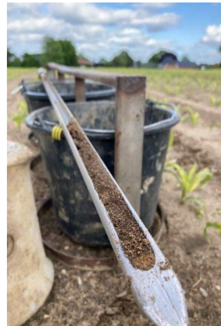
SFN-Probenahme im Mais 2022

Im Rahmen der diesjährigen SFN-Untersuchung wurden vom 25.05. bis 13.06.2022 insgesamt 84 Flächen beprobt. Hierbei lag der Mittelwert bei 132 kg N/ha, wobei die Werte zwischen 29 und 333 kg N/ha schwankten. Durch die lokal teilweise hohen Niederschlagsmengen kam es in einigen Regionen zur Verlagerung von Teilen des Stickstoffs bis in die Bodenschicht 30-60 cm. Dieser Stickstoff steht dem Silomais